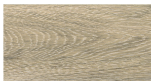
U07 Grigio OIL UV