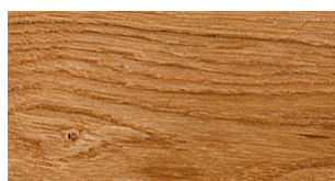
U11 Vernice OIL UV