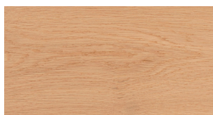
V15 Invisible Lacquer