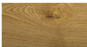
U09 Smoked OIL UV