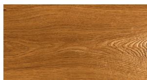
R16 Restaurato Naturale