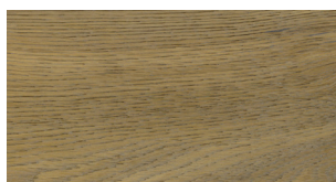
R15 Shore OIL UV