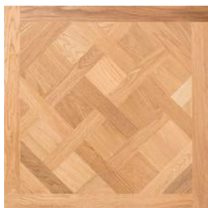
P01 Prelevigato Unfinished

SPESS./THICK 15mm LARGH./WIDTH 1000mm LUNGH./LENGTH 1000mm