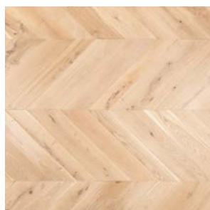
P01 Prelevigato Unfinished