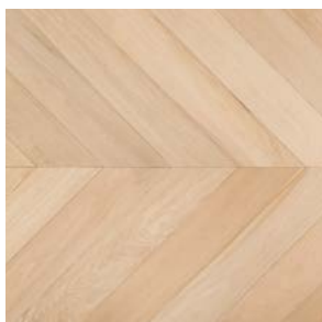
P01 Prelevigato bisellato Unfinished beveled